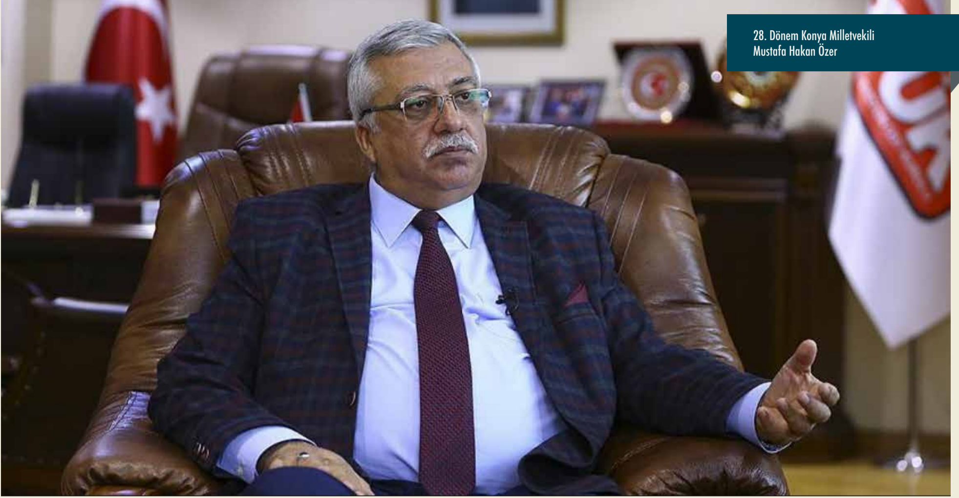
28. Dönem Konya Milletvekili Mustafa Hakan Özer