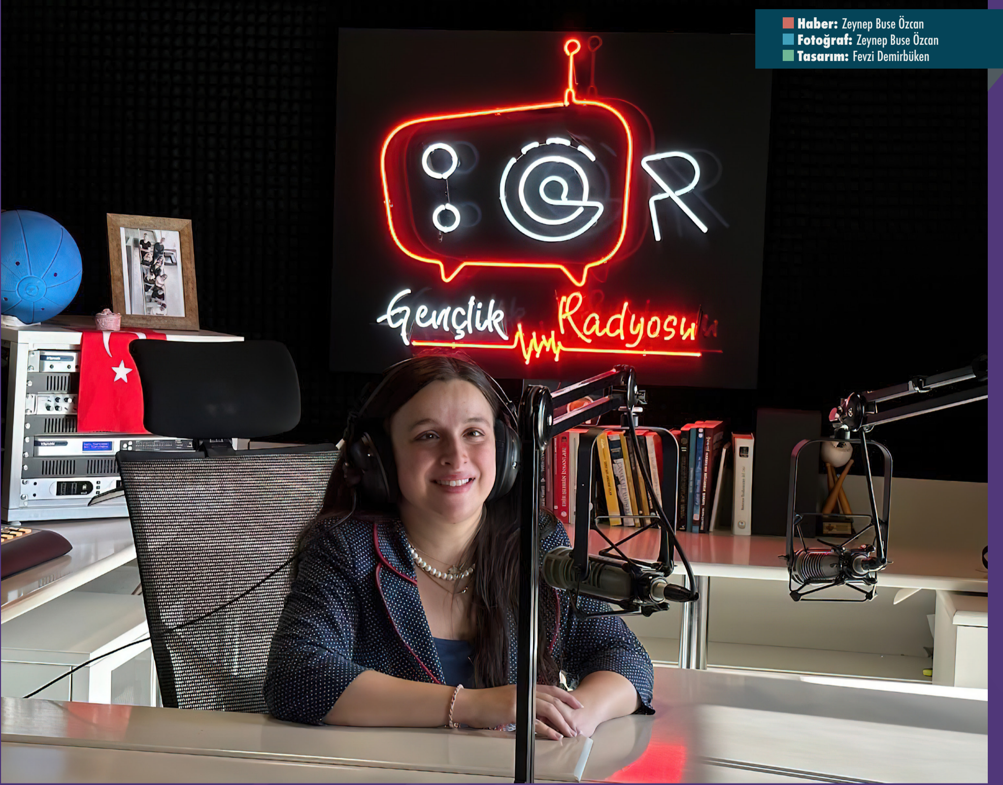
■ Haber: Zeynep Buse Özcan ■ Tasarım: Fevzi Demirbükten